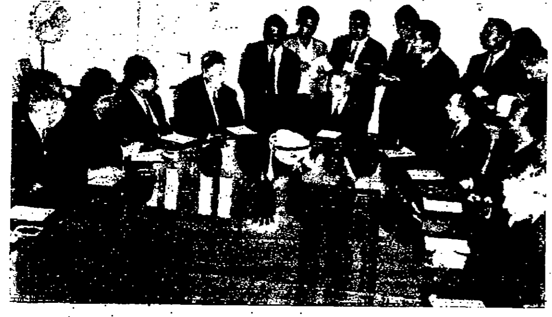
السيد بهجت القاهوني رئيس الوزراء يتحدث الى اعضاء الوفد البلغاري

عمان - استقبل السيد بهجت القاهوني رئيس الوزراء في مكتبه صباح أمس الوفد البرلماني البلغاري برئاسة السيد كيريل لزاروف رئيس مجلس الاتحاد الوطني البلغاري كلمة رئيس الوزراء وقد رحب الرئيس القاهوني بالوفد المضيف وقال: اننا نقدر لبلغارنا مؤتمرا من قضاةنا وتلميذنا المستور لنا في الحفل الدولية اراء قضائنا الذين الوسط، وخاصة قضية فلسطين. البقية على الصفحة السادسة عمود ٥